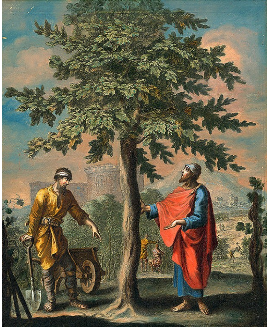
Lucas 13 - de gelijkenis van de onvruchtbare vijgenboom Jan Luyken